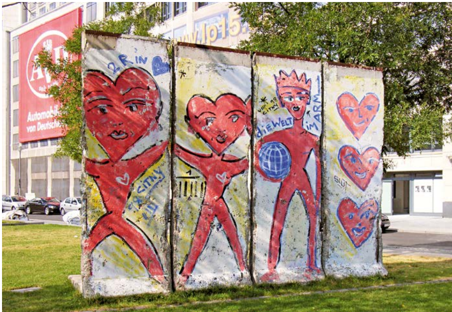
Mauerrest am Leipziger Platz in Berlin: Der Verfall vieler Innenstädte konnte nach dem Fall des „Eisernen Vorhangs“ aufgehalten werden.

Berlin – Die Fraktionen des Deutschen Bundestages haben in der Sitzung des Ausschusses für Wirtschaft und Energie am 5. November 2014 unterschiedliche Schlüsse aus dem jüngsten Bericht der Bundesregierung zum Stand der deutschen Einheit gezogen. Während die Koalitionsfraktionen CDU/CSU und SPD auf die Erfolge verwiesen, vermissten die Oppositionsfraktionen DIE LINKE und BÜNDNIS 90/DIE GRÜNEN die ihrer Ansicht nach notwendigen Schlussfolgerungen aus den Analysen des Berichts.